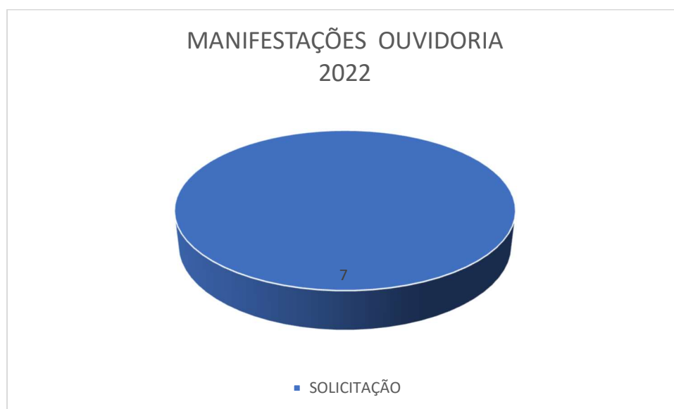
Gráfico1: Manifestação Ouvidoria 2022

No exercício de 2022, o IPREJUN recebeu um total de 09 manifestações, sendo duas duplicadas, de forma que totalizam 07 manifestações no período, evidenciado por gráfico1.